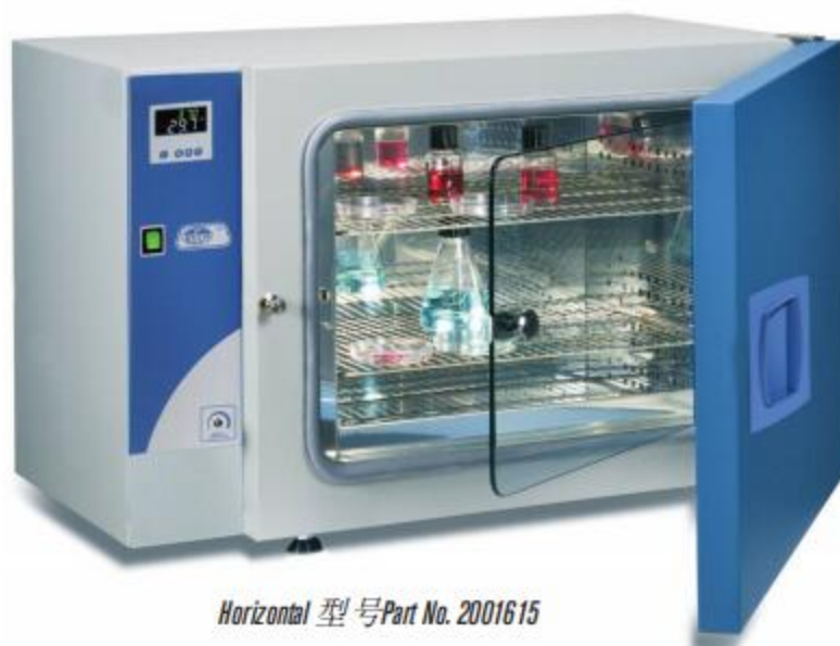
Horizontal 型号Part No. 2001615