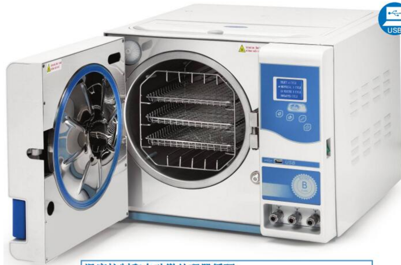
温度控制和自动微处理器循环