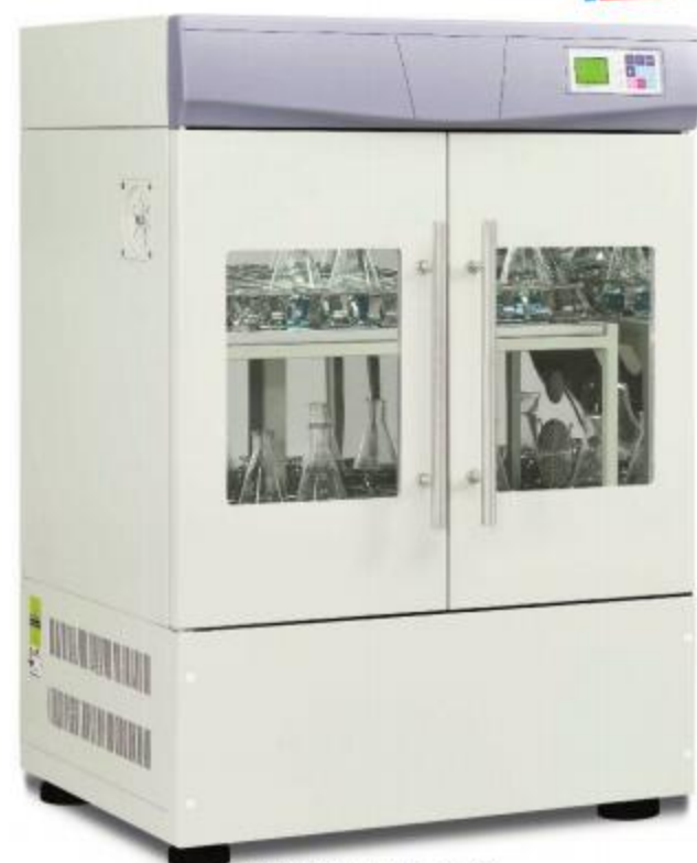
S1102 和 S2102 系列