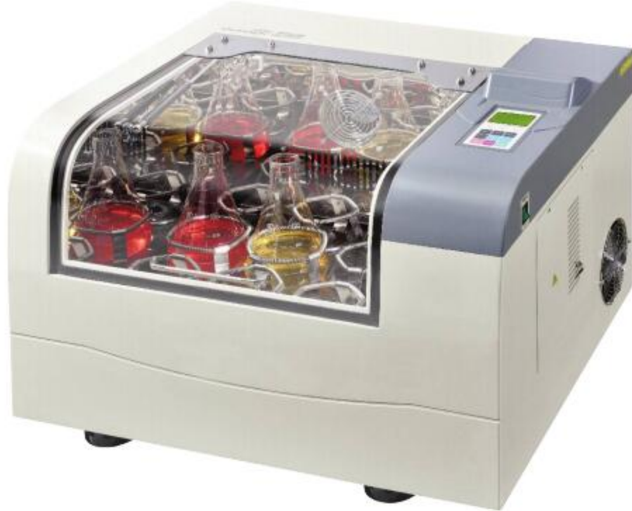
带制冷的铰链式型号