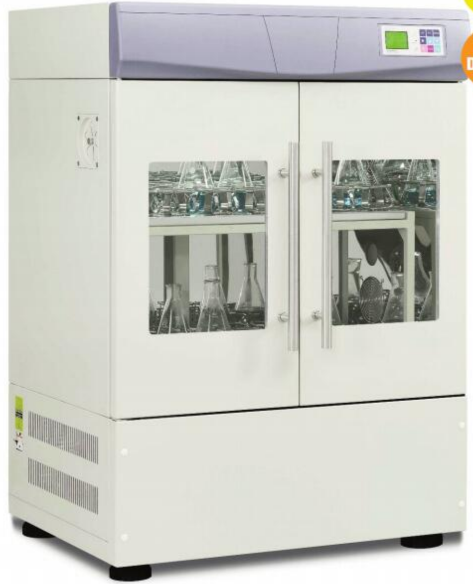
框架式型号 (有/无制冷)

由双门框架型和双玻璃窗制成, 可以看到内部暴露的材料 两个可拆卸的上部托盘, 用于容纳下部托盘中大容量锥形烧瓶 腔室内空气的可调出口孔 振荡幅度: 25mm 带有用于移动的轮子和用于稳定固定的可调支架 配件: 见41页