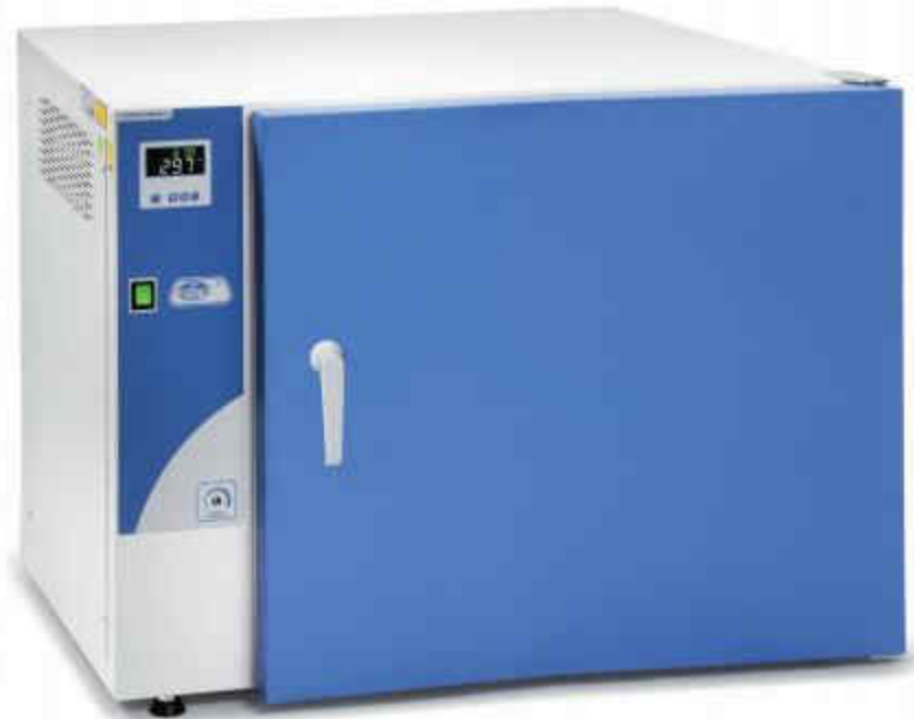
Conterm 型号, 类型Poupinel, Part No. 2000252 和 2000254