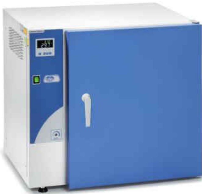
Conterm 型号, Part No. 2000250, 2000251 和 2000253