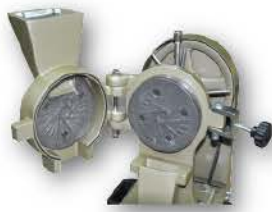
刀片內部 A close-up photo of the frictional disc set.