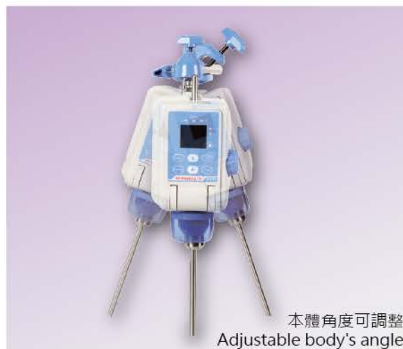
本體角度可調整 Adjustable body's angle