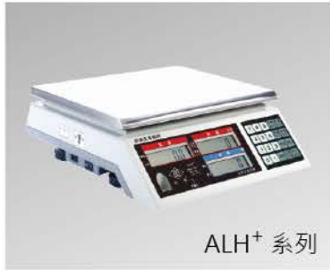
ALH + 系列