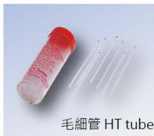
毛細管 HT tube

讀板、毛細管另購。 Reader and HT tubes not included.