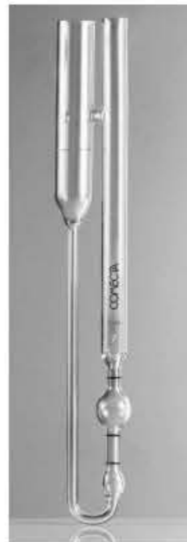
U-Tube reverse flow

适用于不透明液体。 附有40 和 100 °C校准证书。 标称总长度275 mm。 永久性的琥珀色环印。