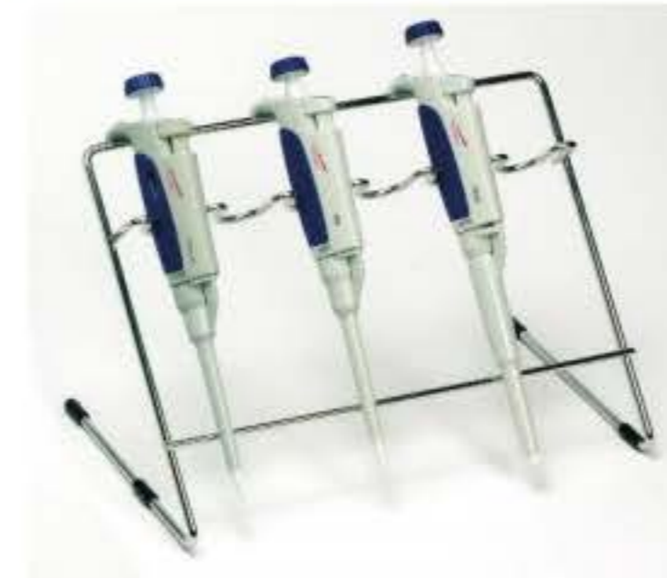
吸管架 由AISI304不锈钢制成。位置数量：6个分配移液管，最长28厘米。 Part No. 1001215